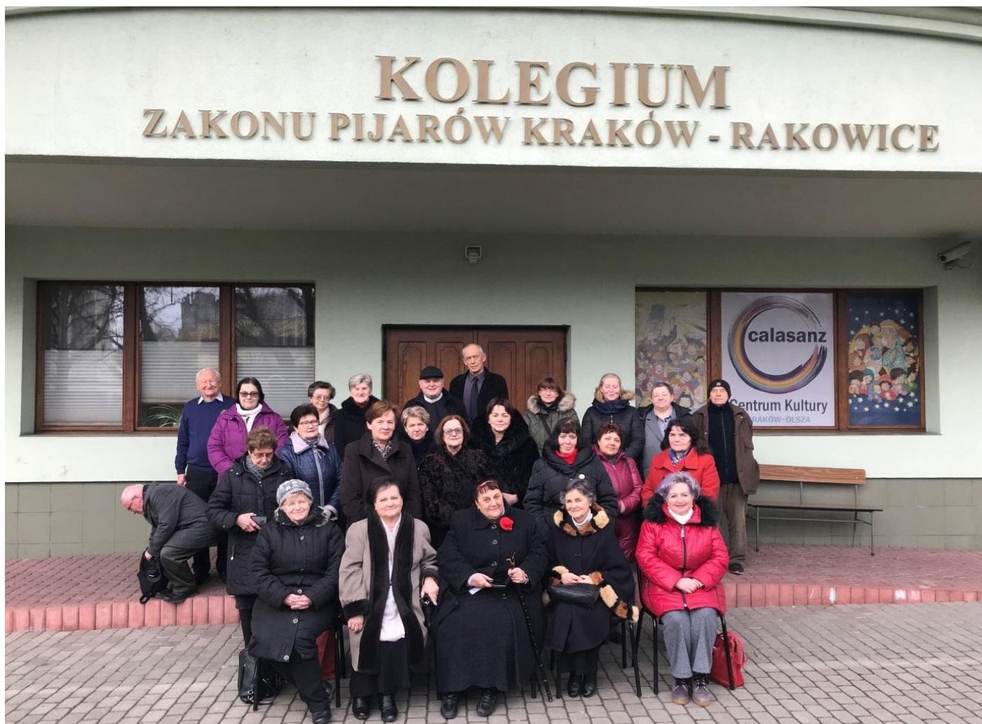
Uczestnicy krakowskiego spotkania.