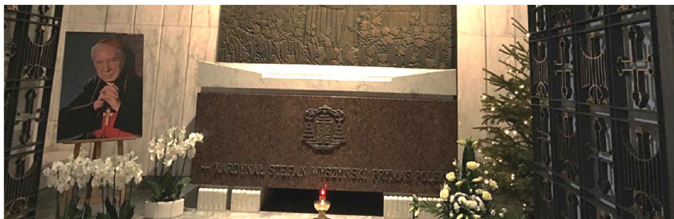
1 lutego 2020 r. - nawiedzenie grobu Prymasa Tysiąclecia Kardynała Stefana Wyszyńskiego w bazylice archikatedralnej św. Jana Chrzciciela w Warszawie przez pielgrzymów czyżewskich.

1 - 2 lutego 2020 r. Ogólnopolskie Nocne Czuwanie na Jasnej Górze w Kaplicy Cudownego Obrazu Matki Bożej