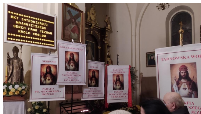
Przedstawiciele Służb Mundurowych wypowiadają słowa Aktu Intronizacji Najświętszego Serca Pana Jezusa