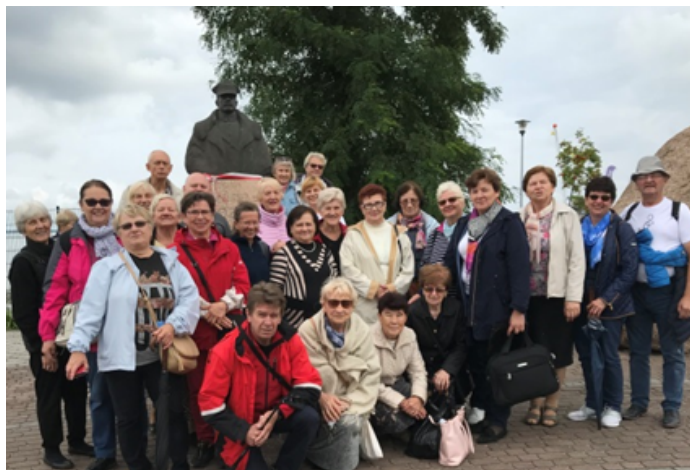
Pomnik „Zaślubiny Polski z morzem”, gen. Józef Haller