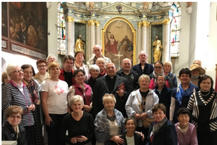
Kościół pw. św. Apostołów Piotra i Pawła w Pucku