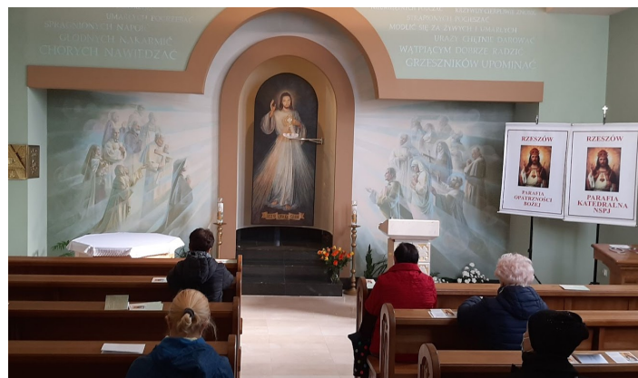
Czuwanie przedstawicieli Wspólnot Dzieła Intronizacji NSPJ na adoracji Najświętszego Sakramentu