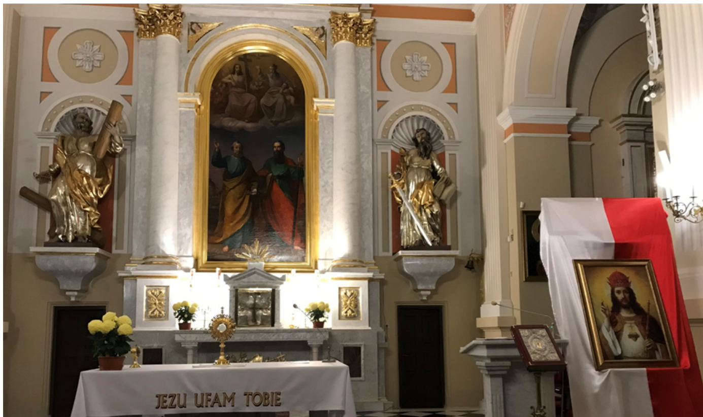
Kościół pw. św. Ap. Piotra i Pawła w Czyżewie - diecezja łomżyńska, modlitwa nowenna w intencji Ojczyzny

21 listopada 2021 r. w Uroczystość Jezusa Chrystusa Króla Wszechświata, Wspólnoty uczestniczyły w Eucharystii, oprawie liturgicznej Mszy św. i adoracji Najświętszego Sakramentu.