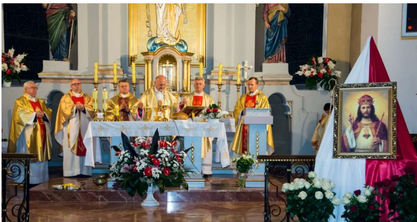
Poręba – uroczysta Msza Św. Intronizacji NSPJ – przewodniczy J.E. Bp. Stanisław Stefanek.