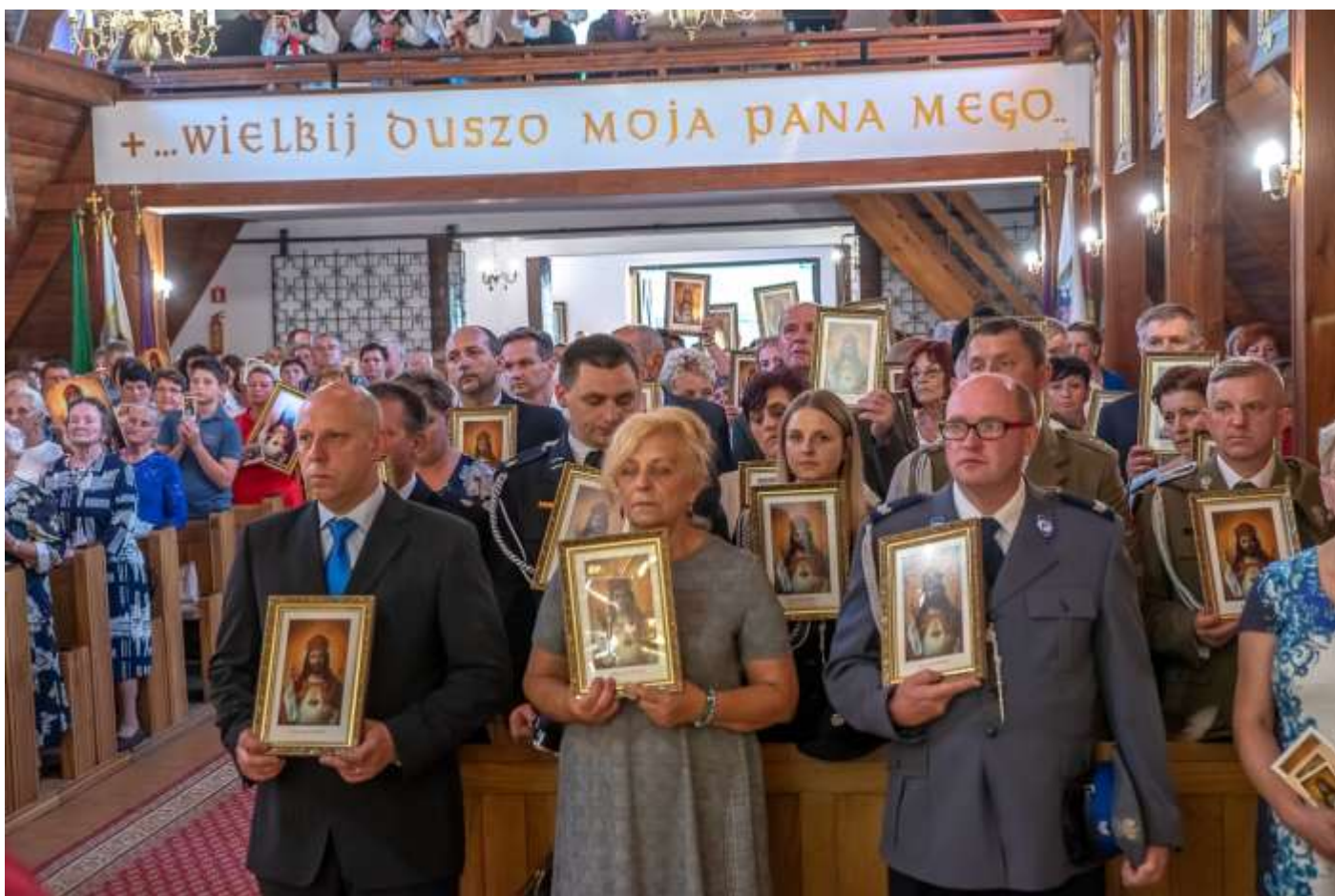
Spolecznosc Matysowki uwielbila Jezusa swego Króla i Pana.