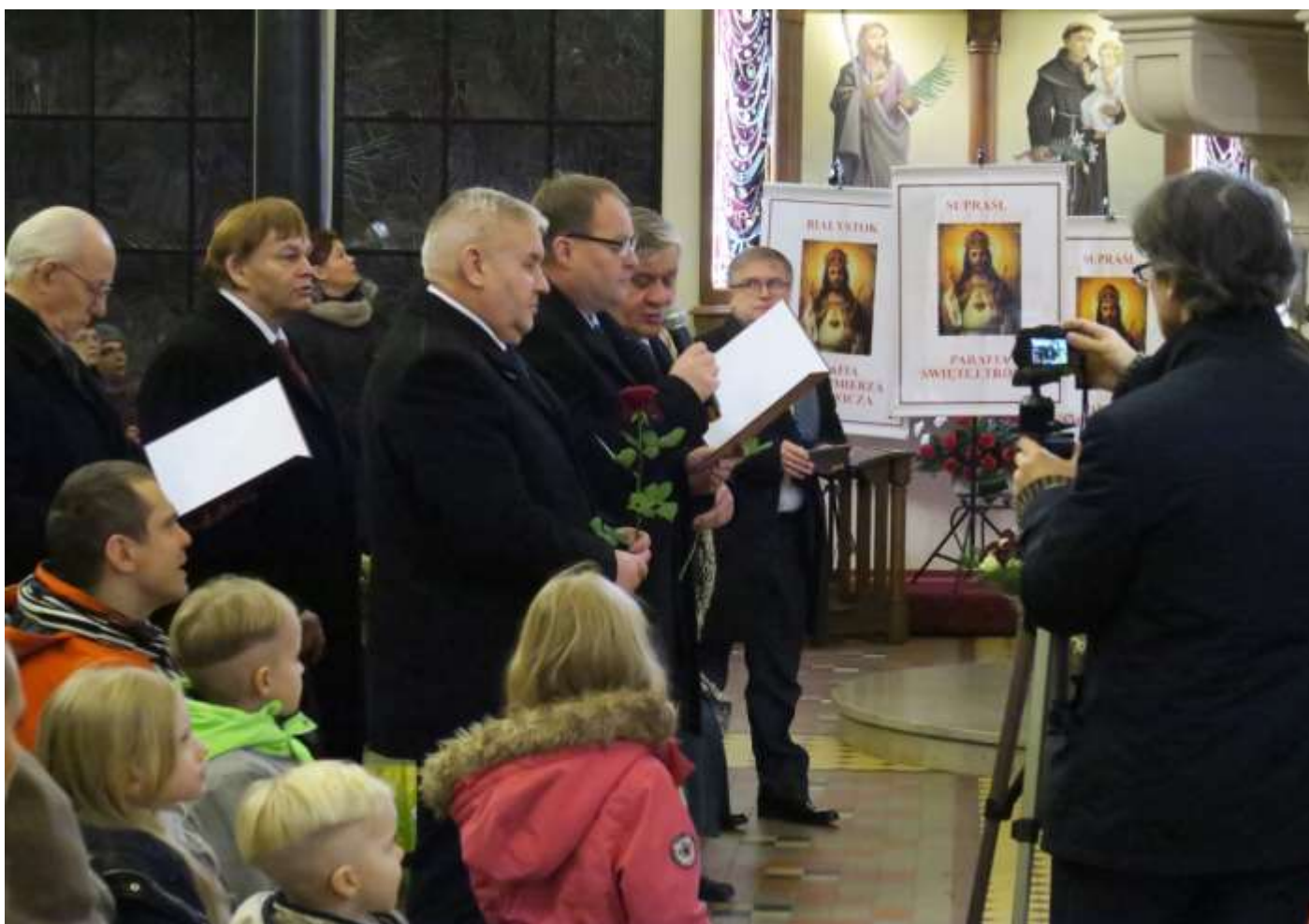
Jezusa Króla zapraszają parlamentarzyści wraz z panem ministrem Krzysztofem Jurgielem.