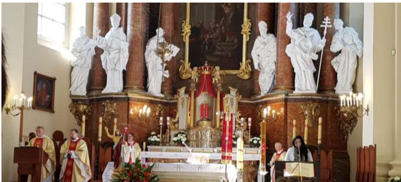
Rekolekcje diecezjalne animatorów Wspólnot diecezji białostockiej.