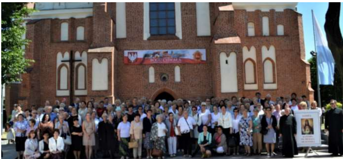
Święto Serca Jezusa spotkanie diecezjalne animatorów Wspólnot w katedrze z J.E. Biskupem.