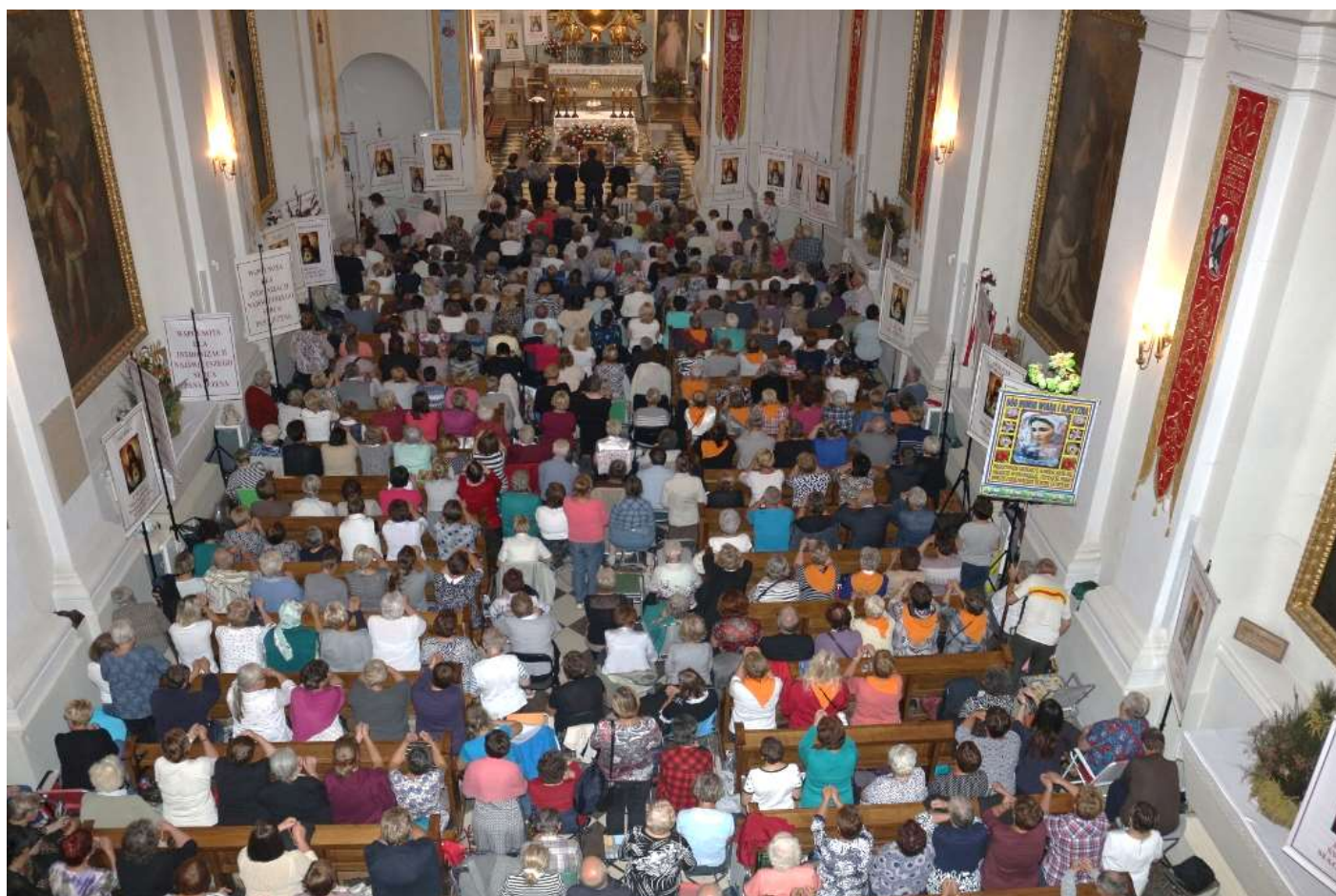
Św. Krzyż ogólnopolskie czuwanie modlitewne Wspólnot