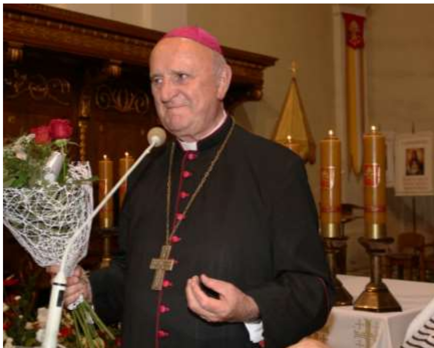
Ogólnopolskie czuwanie Wspólnot na Świętym Krzyżu.