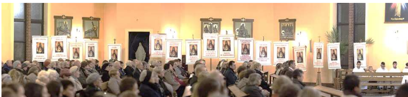
Intronizacja NSPJ w Sandomierzu MB Królowej Polski- przedstawiciele Wspólnot.