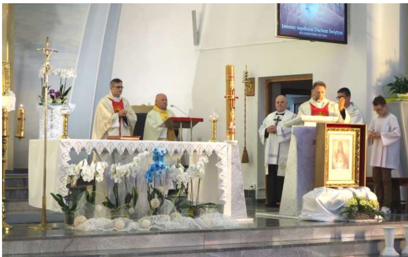
Intronizacja NSPJ w Boguchwale, diecezja rzeszowska