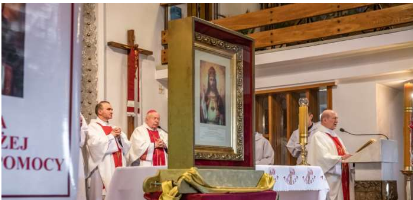
Intronizacja NSPJ w Niechobrze pod przewodnictwem JE Bp. Stanisława Górnego.