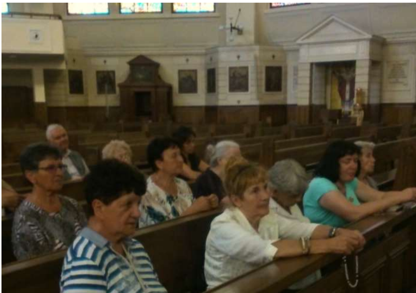
Rekolekcje animatorów diecezji wrocławskiej we Wrocławiu w parafii Św. Franciszka z Asyżu.