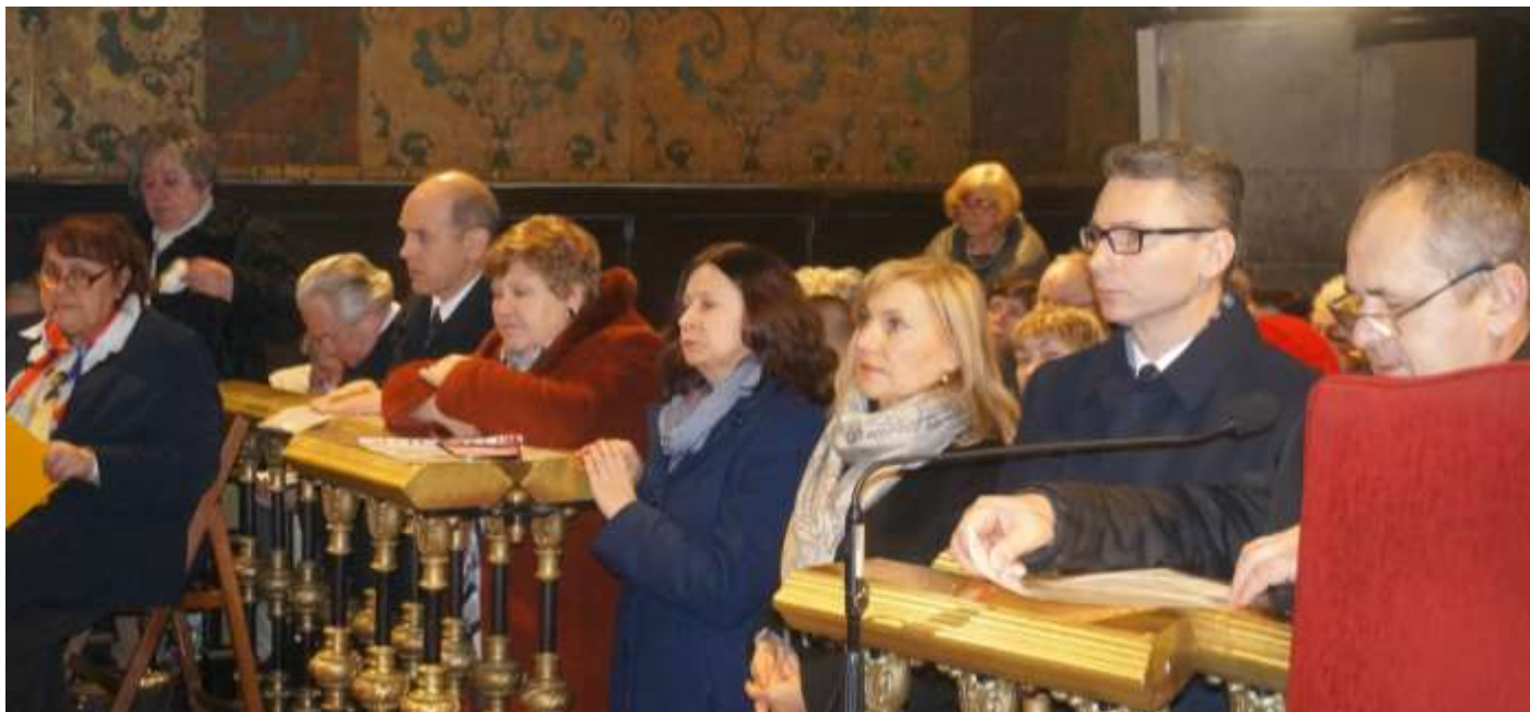
Modlitwa Wspólnoty parlamentarnej na Jasnej Górze.