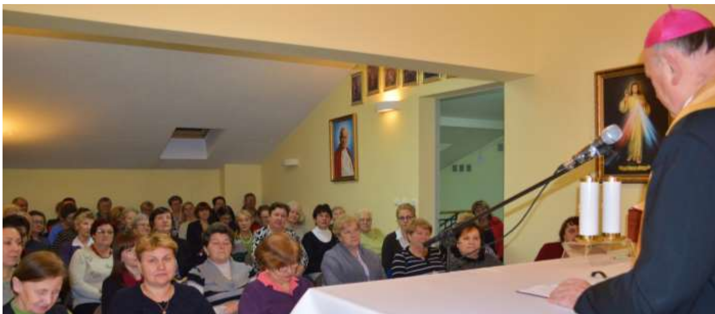
Rekolekcje animatorów Wspólnot diecezji łomżyńskiej .