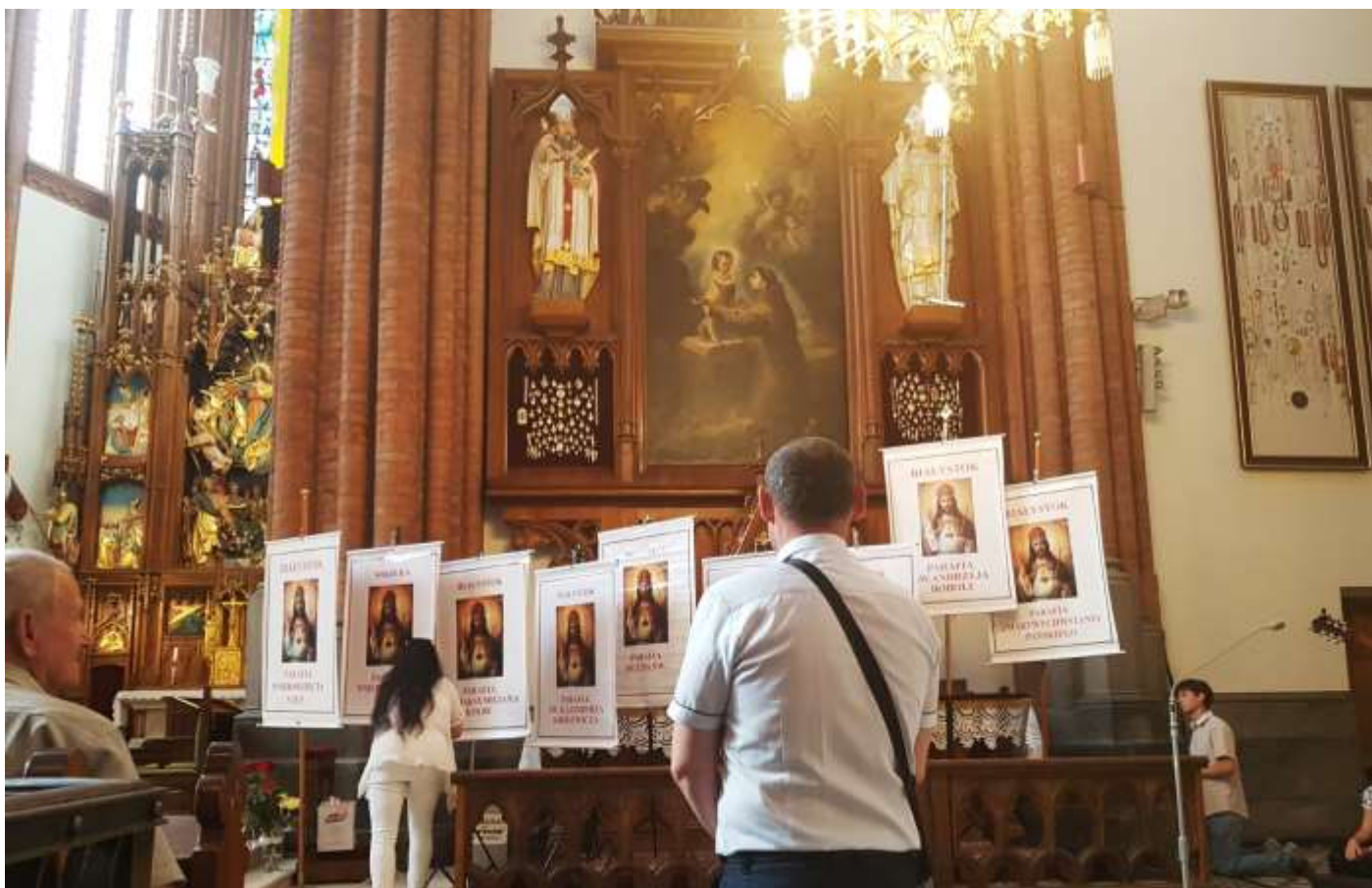
Modlitwa Wspólnot w diecezji białostockiej.