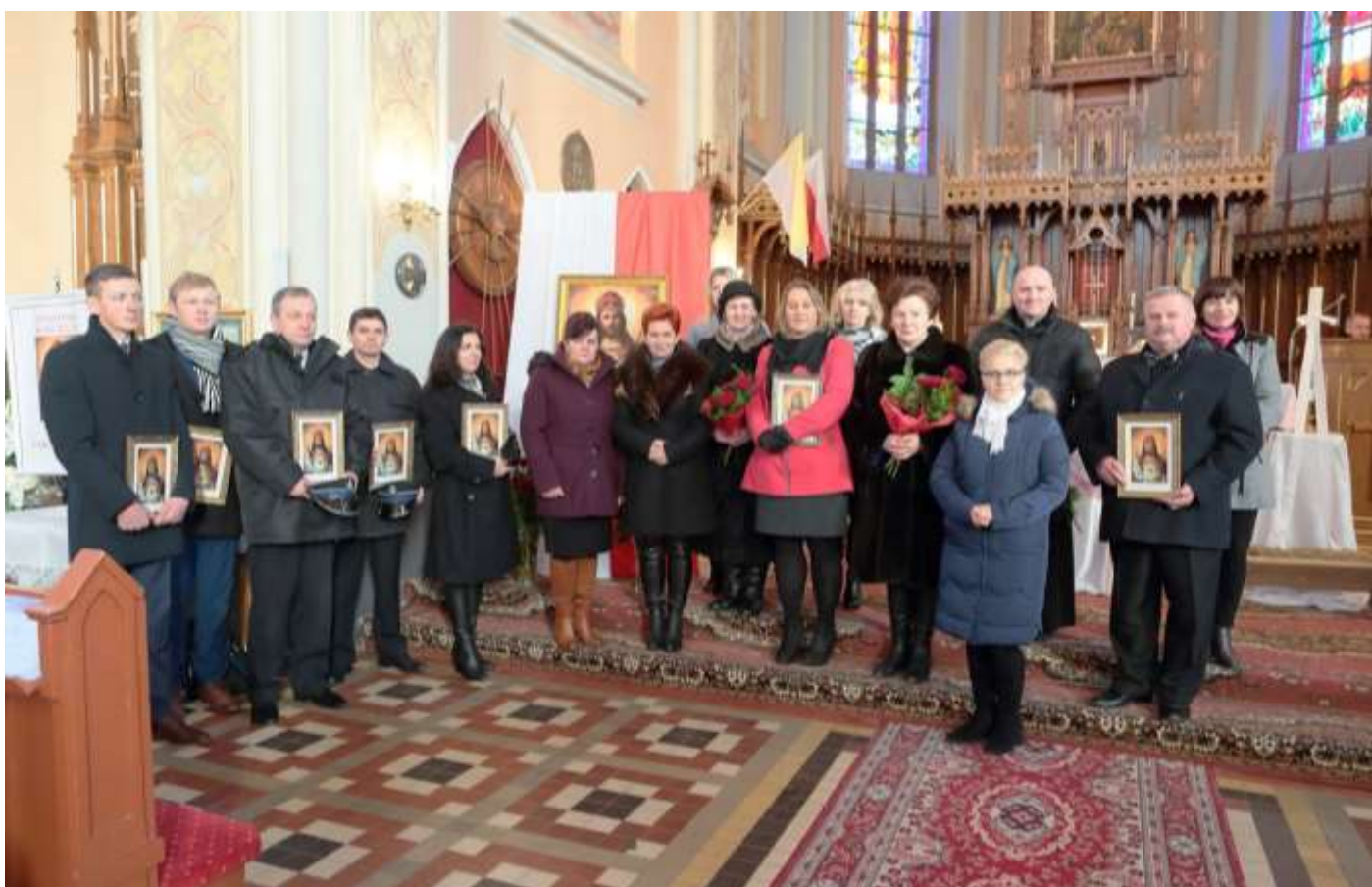
Wyszonki – Intronizacja NSPJ - przedstawiciele delegacji społecznych