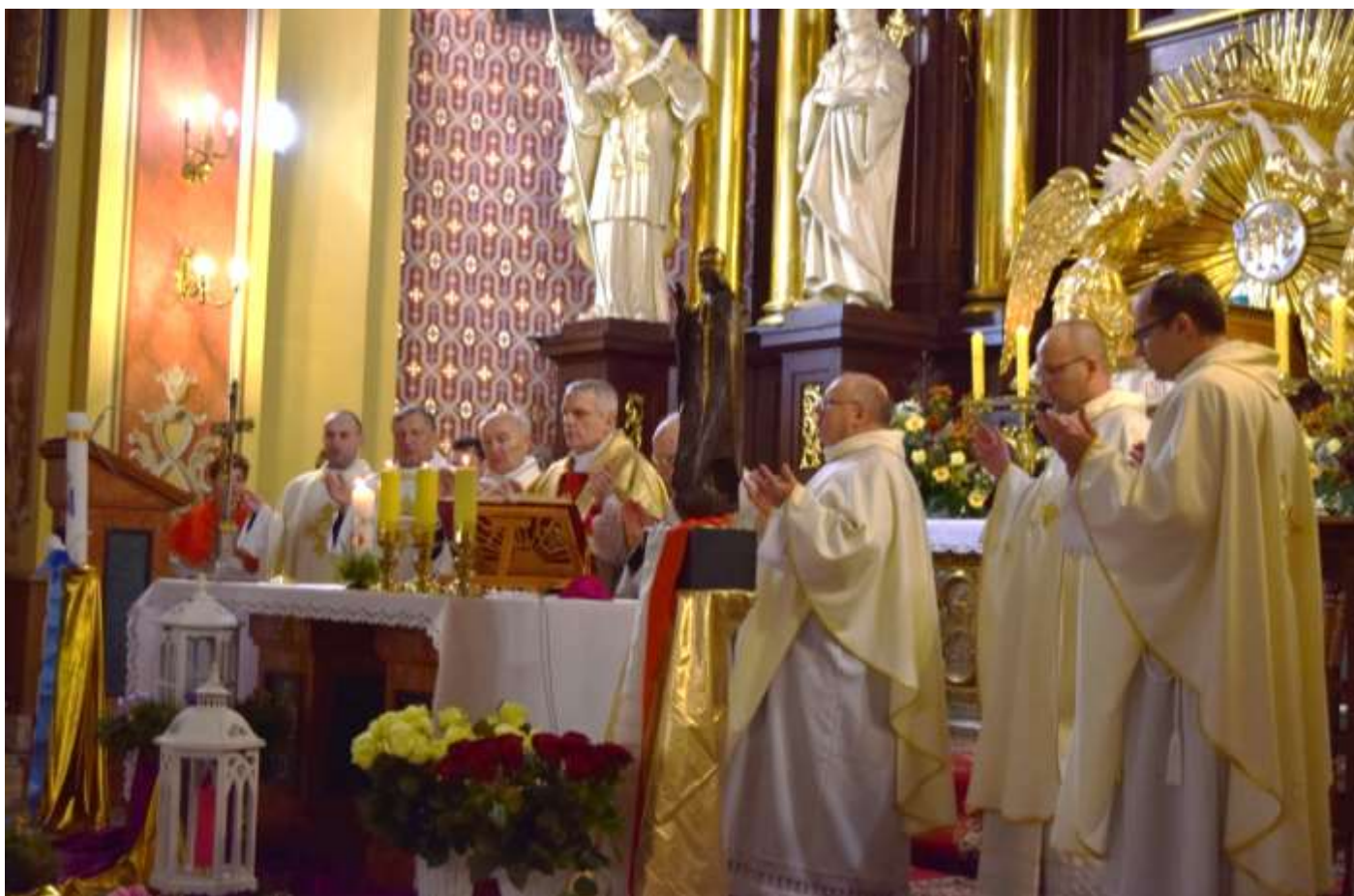
Jaroslaw – XX lecie Intronizacji NSPJ – przewodniczy J.E. Bp. Stanisław Jamrozek.