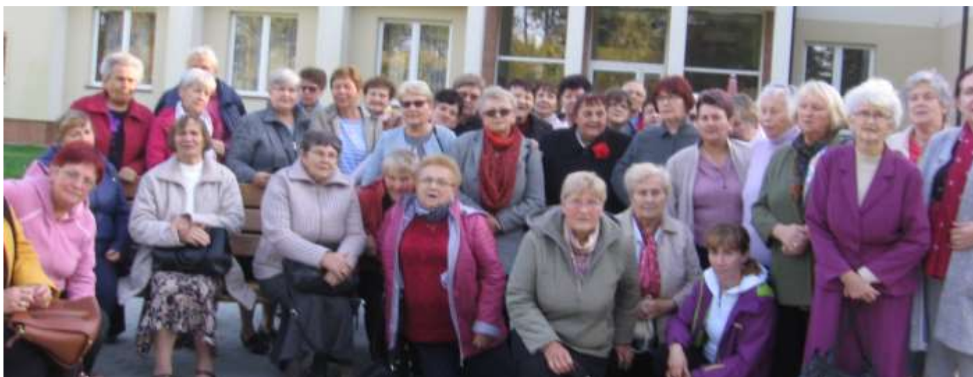
Rekolekcje animatorów Wspólnot w Budach Głogowskich