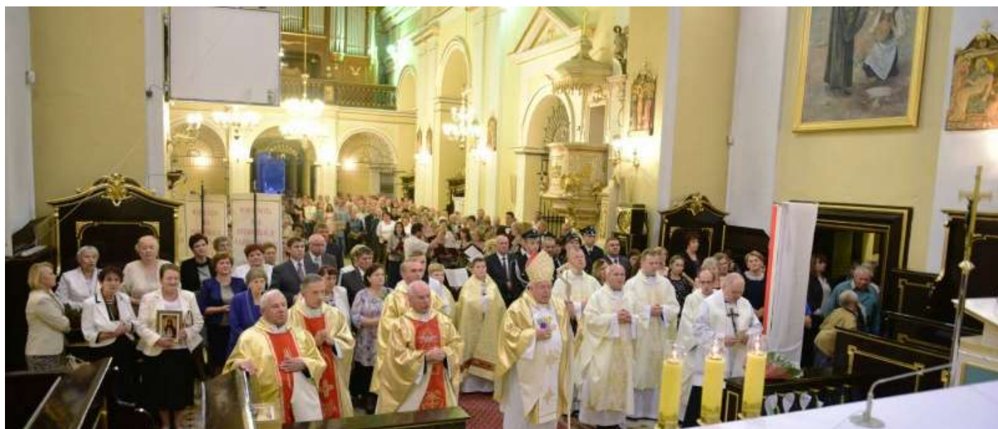
Intronizacja NSPJ w Czudcu z udziałem J.E. Bp. Kazimierza Górnego.