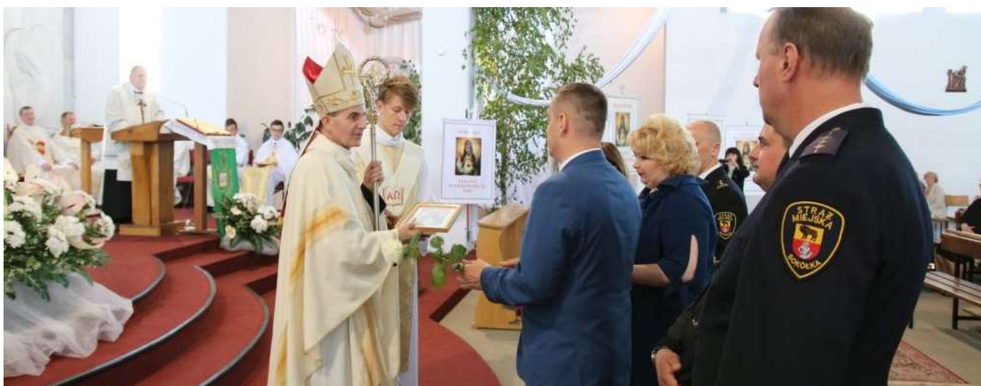
Intronizacja Najświętszego Serca Pana Jezusa w Sokółce, przekazanie obrazów.