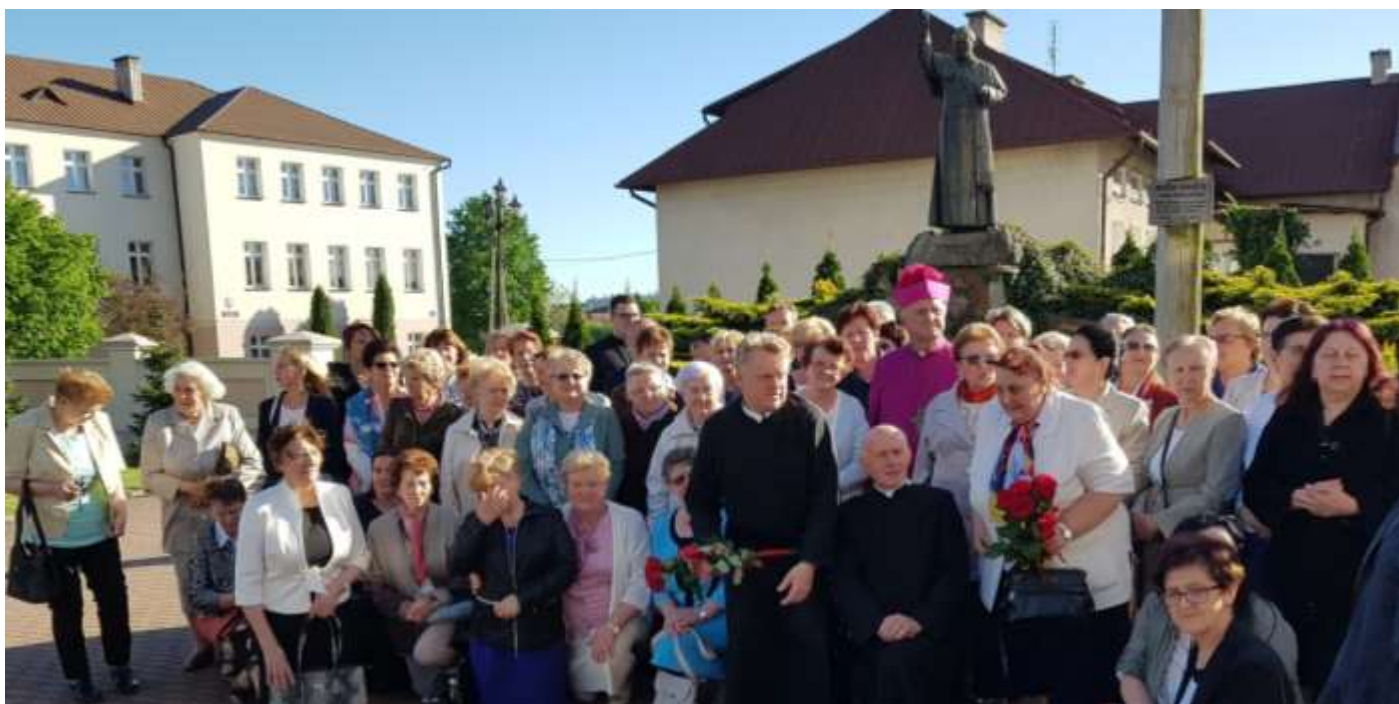
Uroczysta Msza Św. i spotkanie jubileuszowe w parafii Wysokie Mazowieckie