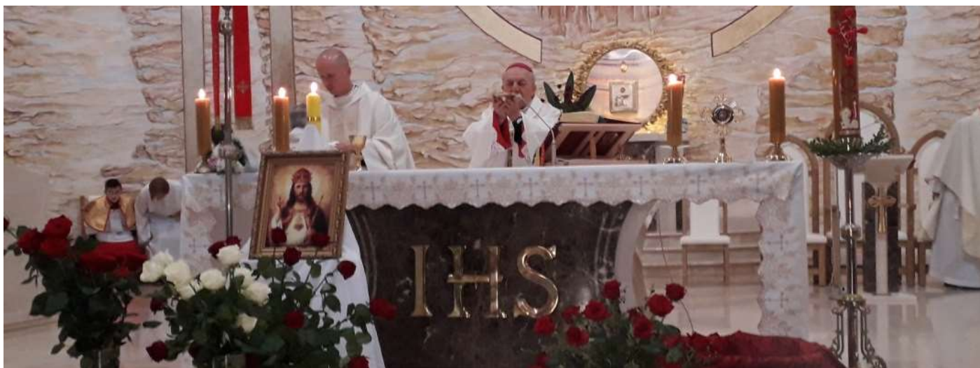
Sandomierz - Msza Św. Intronizacyjna pod przewodnictwem JE. Bp. Edwarda Frankowskiego