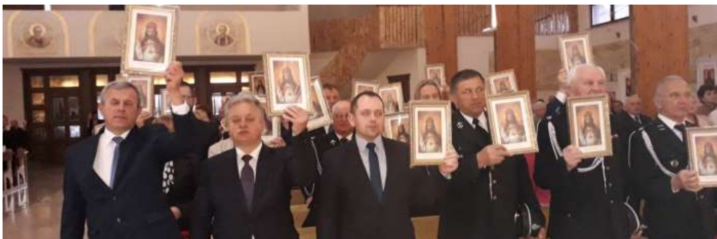
Władze samorządowe i grupy społeczne wyznają że Jezus jest Królem ich serc i życia.