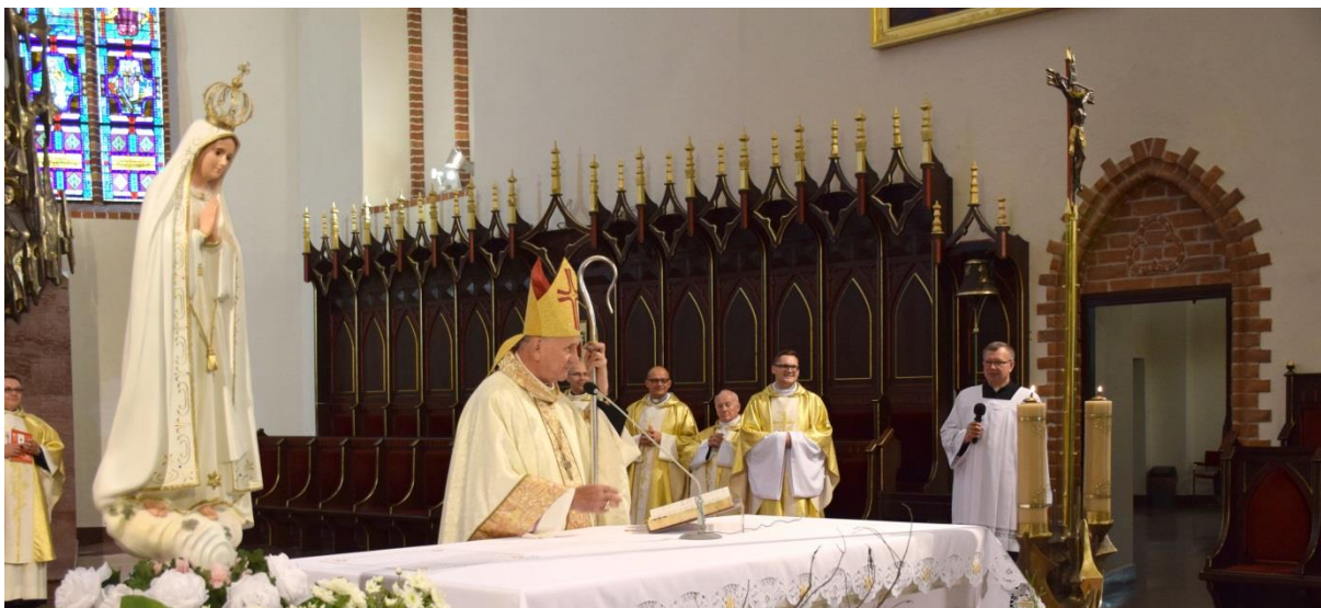
23.06.17 Wspólnoty na Mszy Św. w katedrze łódzkiej z Bp. Stanisławem Stefankiem