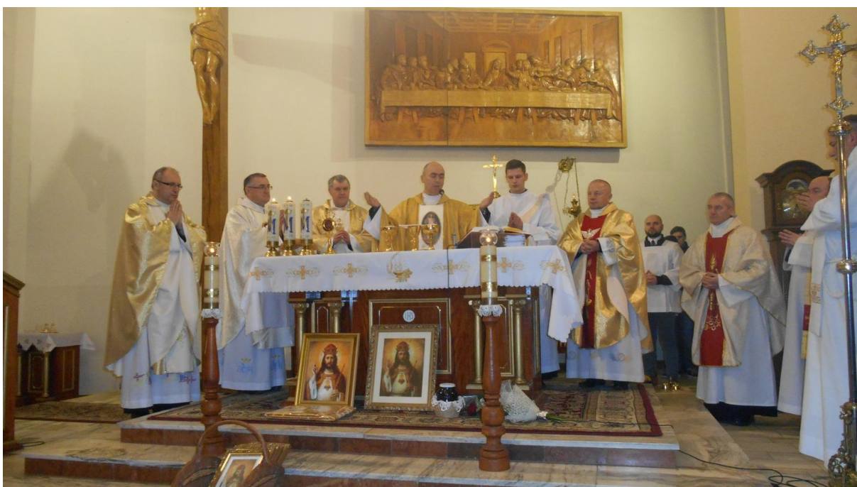
Intronizacja Najświętszego Serca Pana Jezusa w Zdziłowicach

12.03 – 15.03. 17 r. Intronizacja NSPJ w Jaśle.