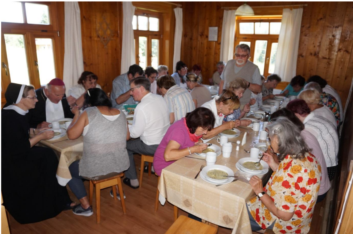
Rekolekcje na Ryniasie animatorów Wspólnot z całej Polski 11.08 -15.08. 17 Przygotowanie rozważań na spotkania comiesięczne dla Wspólnot