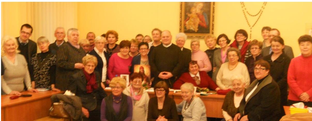
Dzień Skupienia w Toruniu