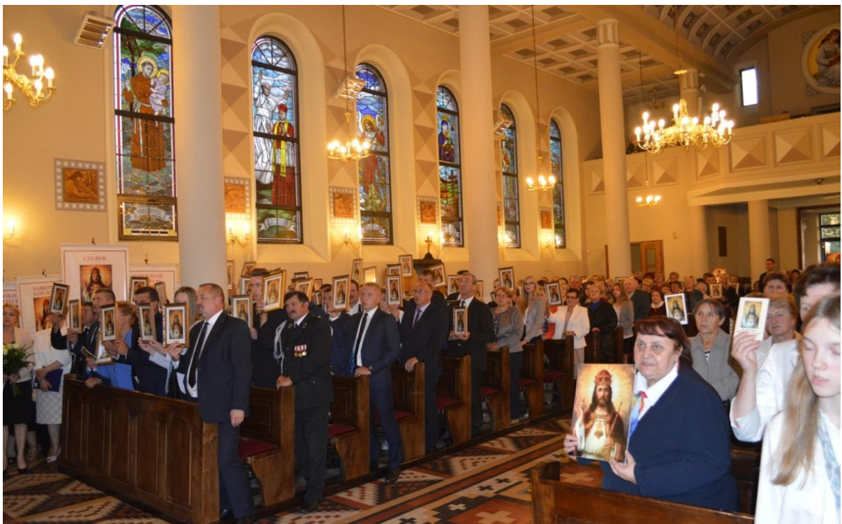
Intronizacja Najświętszego Serca Pana Jezusa w Wojnach Krupach.