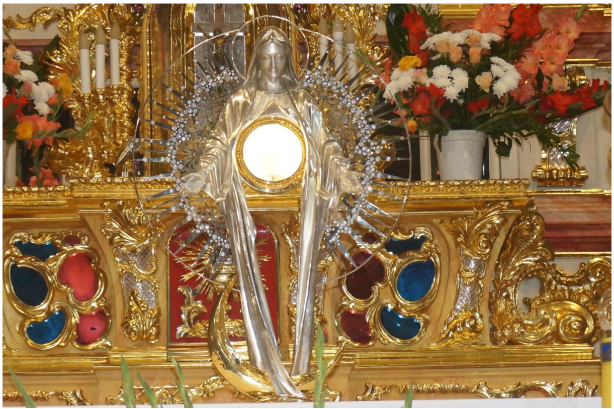
Monstrancja dla Fatimy w 100 lecie objawień ofiarowana przez górali