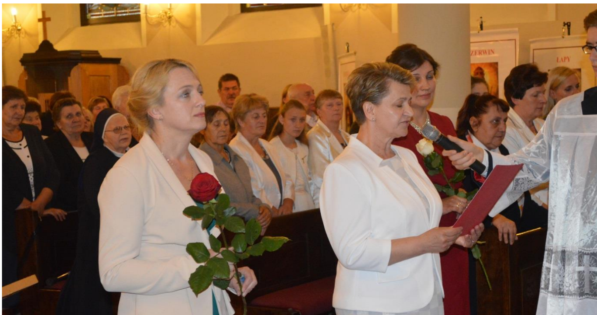
Intronizacja NSPJ w Jabłonce Kościelnej – członkowie Wspólnoty