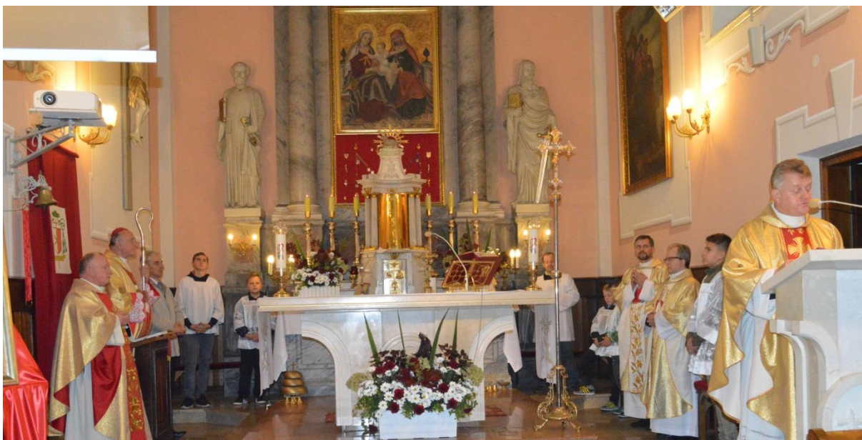
Intronizacja NSPJ w Dąbrówce Kościelnej diecezja łomżyńska

15.10.- 18.10.17 r. Intronizacja NSPJ w Dąbrówce Kościelnej, Mszy Św. przewodniczył JE. Bp. Stanisław Stefanek.