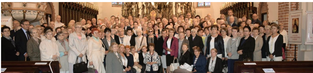
Wspólnoty w katedrze w Święto Najświętszego Serca Pana Jezusa