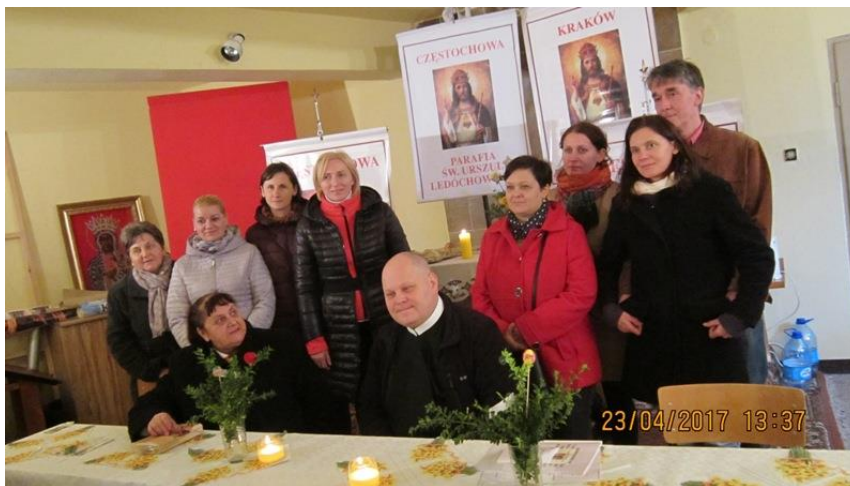
Dzień Skupienia w Częstochowie