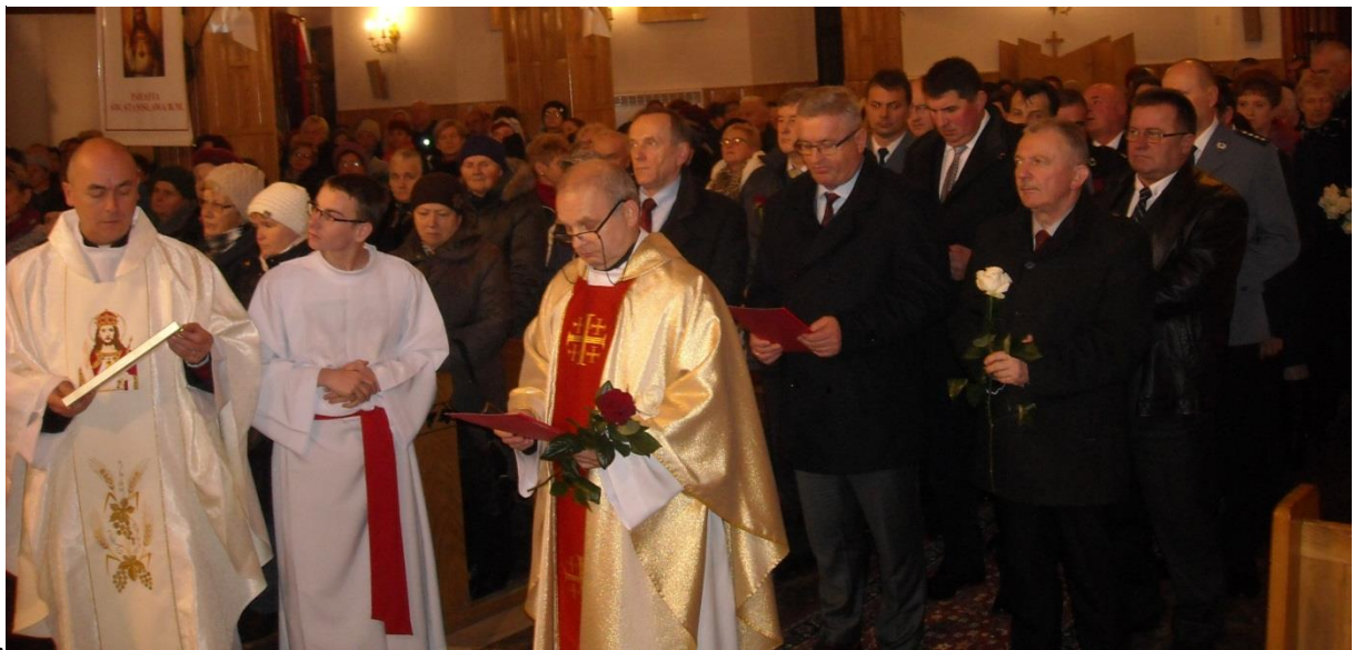
22.11.17 r. Intronizacja NSPJ w Brzezinach Stojeszyskich - diecezja sandomierska