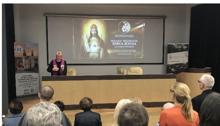
Konferencja o. A. Zajęca w Auli Domu Pielgrzyma