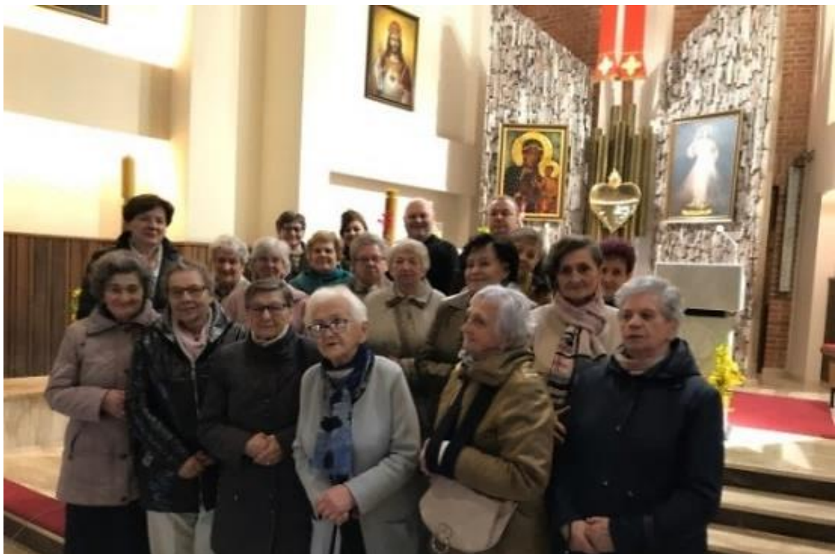
Na spotkanie przybyły animatorki z diecezji łomżyńskiej.