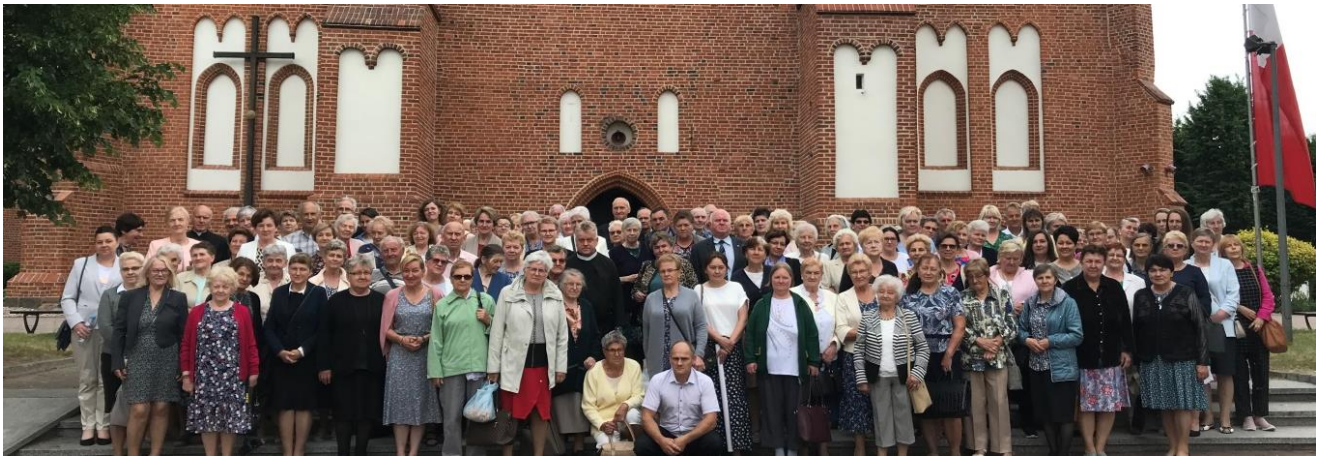
Uczestnicy obchodów 25-lecia Dzieła Intronizacji NSPJ w diecezji łomżyńskiej.