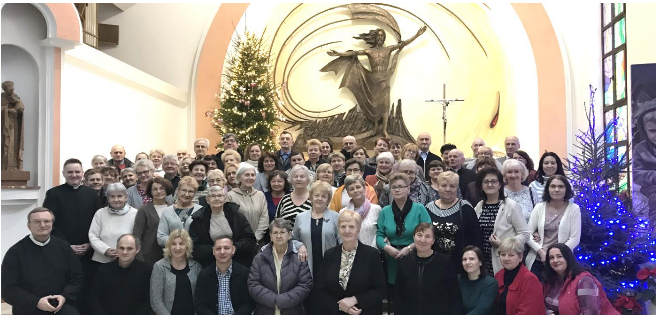
W rekolekcjach uczestniczyło około 80 osób.