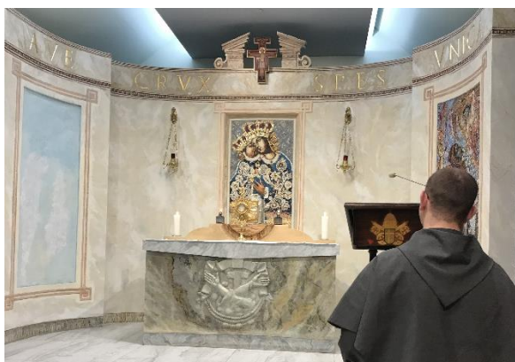
Adoracja nocna przed Najświętszym Sakramentem