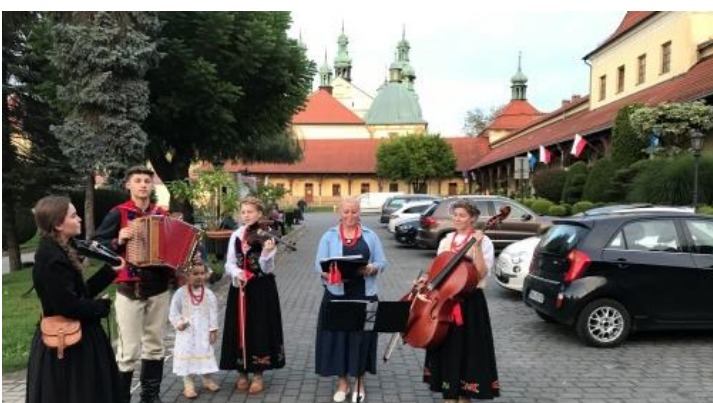
Kapela rodzinna Sikorski Wspólnota z diecezji bielsko-żywieckiej